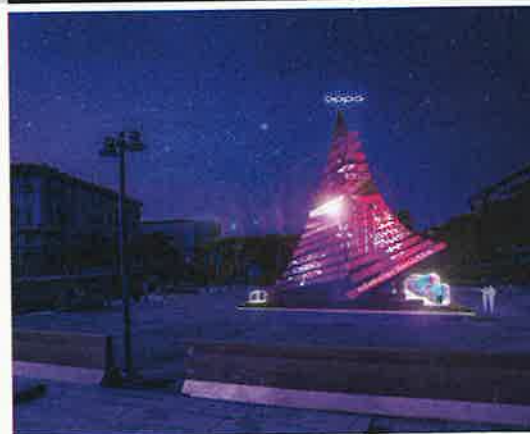
Dall'alto, Dundu in uno show a Bucarest e l'Oppo Xmas Tree che il gigante luminoso accenderà giovedì 6