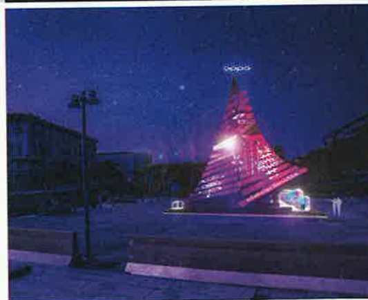
Dall'alto, Dundu in uno show a Bucarest e l'Oppo Xmas Tree che il gigante luminoso accenderà giovedì 6