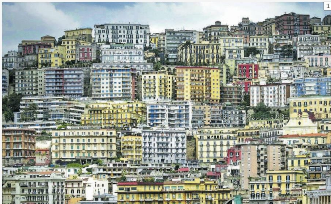
Inumeri CASE A PREZZI SOSTENIBILI IL FABBISOGNO STIMATO NEL MONDO

«Progettiamo ecosistemi urbani in cui è prevista un'integrazione organica di diversi fattori: dall'emergenza abitativa alla sostenibilità, dall'inclusione sociale all'applicazione della tecnologia per il funzionamento della città in modo smart – sottolinea il ceo – A livello mondiale abbiamo identificato circa 50 grandi complessi urbanistici in greenfield, cioè di nuova costruzione, che integrano soluzioni smart e che si presentano come piccole nuove smart city». Nel