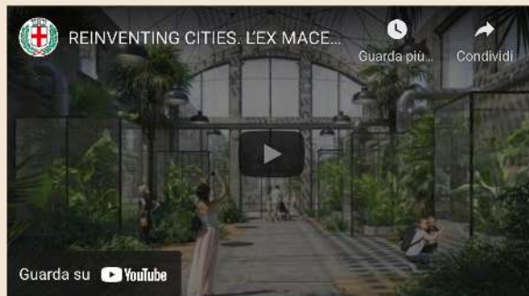
Nuova vita per l'ex Macello Milano

Il nuovo ateneo dello IED, infatti, insieme al POD, il nuovo Science&Art district dedicato alla divulgazione delle competenze STEAM ( science, technology, engineering, art and mathematics ) e delle competenze del futuro, animerà la vita dei cittadini con un palinsesto di iniziative e usi temporanei dedicati alla cultura, alla creatività e alla solidarietà, tenendo insieme proposte culturali di carattere internazionali con la valorizzazione delle esperienze vivaci e originali portate avanti dalle tante realtà del territorio. Studenti e residenti saranno i city makers che renderanno Aria una nuova meta urbana: luoghi di lavoro, di produzione e fruizione di servizi: un abitare sostenibile basato sulle esperienze inclusive e innovative di coabitazione e usi temporanei collaborativi.